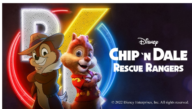
Cip e Ciop: salva i Rangers

All'inizio di quest'anno, Cathay Pacific – che dispone della più grande libreria di film e serie TV a bordo nell'Asia-Pacifico – ha ricevuto il World's Best Inflight Entertainment Award per il 2023 agli SKYTRAX World Airline Awards.